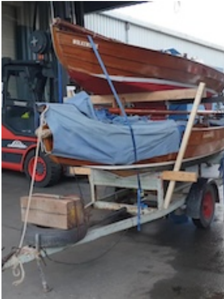
Netjes gestapeld voor de winter