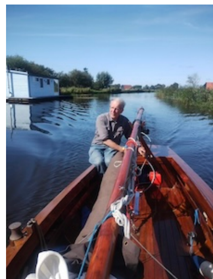
Op naar de Gondelvaart

Je zou de werkgroep Akkrumer jol eigenlijk meer op het water verwachten. Toch hebben we afgelopen watersportseizoen veel bij evenementen op de wal gestaan, showend en pratend over onze liefde voor het houten zeilschip. We waren bij de opening van het waterseizoen in Akkrum, op de Reuzedei, op de markt bij de Gondelvaart en op de bedrijvendagen van de VOAN.